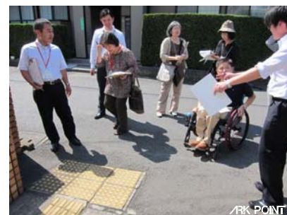
障がいのある人と施設点検のワークショップ