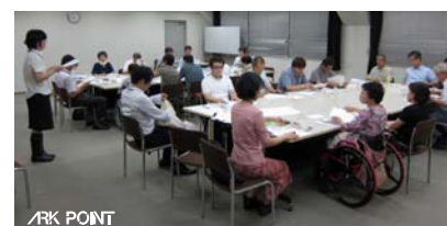
福祉輸送サービスの担い手と利用者との意見交換会