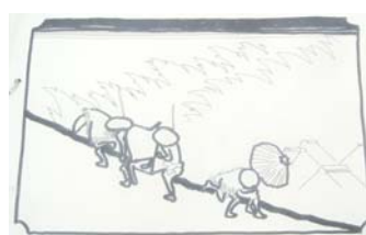
③人の歩いている姿のみ表現