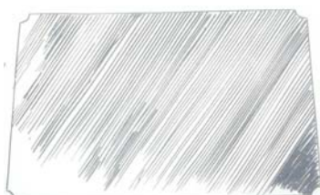
②雨のすごさを表現