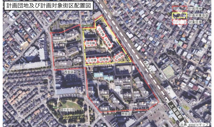
計画団地及び計画対象街区配置図